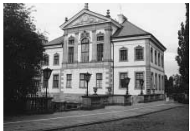
写真5 ショパン博物館

再びモスクワに着く。シェレメチェヴォII国際空港の入国管理に並ぶ人の列は前回よりもさらに長く、入国に約40分待たされた。税関を抜け、タクシーの客引きの声が渦巻く通路を通り、タクシー手配デスクに行く。ホテルの名前を告げると、英語を話す女性が「そのホテルまでの基準料金は75ドルですが60ドルに負けておきましょう」という。それは高すぎるとさらに50ドルに値切るとOKとなり、少し離れたところに駐車してあった車に案内された。旧式の乗用車で、タクシーの表示などはどこにもなく、白タクみたいだ。40分ほど走ってキエフ駅近くのホテルに到着し、