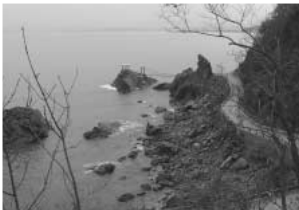
写真4 魚郎～清津間の海岸

機材は旧ソ連製の4発プロペラ機IL18。機体後部を壁で仕切り、片側2座席で3列、計12人が同一仕切り内空間に座る。少し前方にも同じく仕切り空間があるようであったが詳細は不明である。軍人、スチュワーデスが陣取っていた。飛行時間1時間40分。到着地の魚郎空港は軍用空港なので、建物等の民間用施設はない。タラップを降りたところにマイクロバスが待機しており、トランク等を滑走路上で受け取り、すぐ移動だ。以後のホテルでは原則としてお湯も水も出なかった。何故か西洋風バスタブに水がはっており、洗面器で吸って利用する。トイレも同じだ。したがって、清津へ行く前に寄り道をして温泉に入る事になった。温泉名は「塩津」(北朝鮮の地図で記載はなかった)。日本占領時代に建設されたと見られる湯治場が随所に見られた。入浴料は1.5米ドルで、極めて薄く、小さいタオルと石鹸がつく。2、3人で一つの貸し切り浴槽、脱衣所を利用す