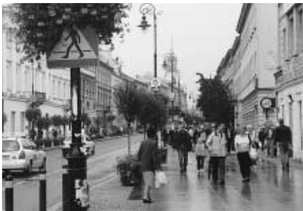
写真2 ワルシャワの新世界通り

街は活気があり、市場経済への移行も順調に進んでいるように見えた。街の一角にケンタッキー・フライドチキン、