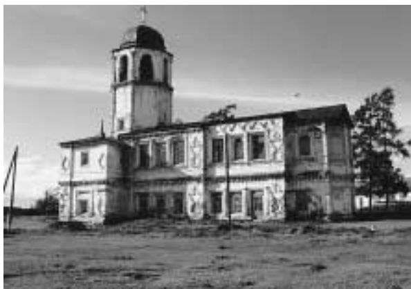
写真12 ポソルスキー・モナストリーの礼拝堂

ル湖がすぐ下に見える。寺院の傍らに設けられた仮の礼拝堂にはロシア正教の宗教画やイコンが多数置かれてあり、目処の立たない復旧工事の終了を待っていた。