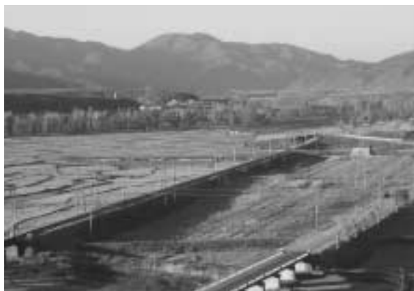
写真5 吉林市に向かう鉄道(会寧付近)

道路は100%未舗装。道路状況も悪く、とてもコンテナ貨物は運べない。荷崩が危惧される。橋梁も痛みが激しく重量物の輸送は困難とみられる。ただ道路幅だけは2車線分確保してある。道路に平行して走る鉄道は単線で、保線状態は極めて劣悪である。途中一回電気機関車が駅構内で