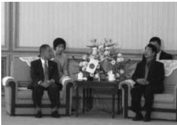
写真2 黒龍江省表敬訪問

一行はまず北京の政府中枢にミッションの目的・意義や日本の東北地域・東経連のPRを行った後、東北3省を訪れて表敬訪問、経済交流意見交換会、企業視察などを行った。北京では王春正・国家発展計画委員会副主任や丁石孫・全国人民代表大會常務委員会副委員長などが、東北3省では王先民・黒龍江省副省長、王雲坤・中国共産党吉林省委員会書記、趙新良・遼寧省副省長などが表敬訪問=写真2、意見交換、記者インタビューに応じ、日本の東北経済界のトップミッションに対する十分な敬意と評価を示す対応ぶりだった。