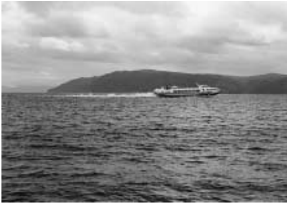
写真20 バイカル湖を行く水中翼船

ミナルビルも隙間風が吹き込んで来そうな古さだ。ダリアピア航空のツポレフ154型機はここでも満席で、機内ではパンと紅茶の朝食が出された。約3時間の飛行だがイルクーツクとは2時間の時差がある上に到着が遅れたため、着いた時には午後になっていた。