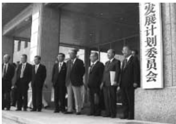
写真1 ミッション団長・顧問・副団長

日中双方の東北地域においてこれまで行われてきた点と点の交流を進展させ、面と面との交流を目指したミッションの狙いは各訪問先で歓迎された。同時に、空港・港湾を基点とする従来の経済交流が、広域連携にもとづく裾野の広い産業交流へと発展する足掛かりを得たミッションだったといえよう。