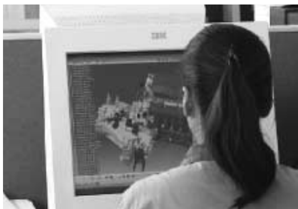
写真3 CATIA (3次元設計ソフト)を活用

筆者は記者団とともにハルビン東安自動車発動機製造有限公司を訪問 = 写真3。同社は、中国の自動車市場の中心