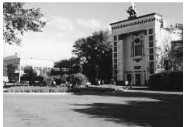
写真7 オペラハウス