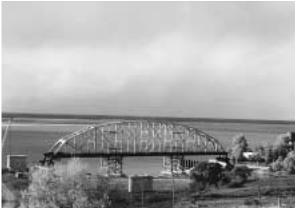
写真23 岸辺に保存されているアムール川旧鉄道の一部

9月21日、朝、郷土誌博物館を見学。外国人料金は80ルーブル也。石造りの建物を背景に黄葉が鮮やかに映える景観はアメリカ中西部の秋を思い出させる。