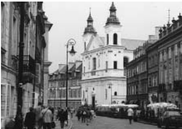
写真4 旧市街から新市街へ

ピザハット、屋台、アイスクリーム屋などが並んでいるファストフード広場のようなところがあり、夕方は若い人で賑わっている。また、地下街には「Oscar」という小さな国産系ファストフード店が至る所にあって、ピザやサンドイッチを頼める若者で一杯だ。レストラン、デパートや商店も多く、物も豊富である。街角の至る所に「KANTOR」と表示された両替屋がある。私も米ドルを両替したが、ワルシャワ市民が両替している通貨は何だろうか。どうしてポーランドの人は外貨を替えなければいけないほど持っているのか良く分からない。