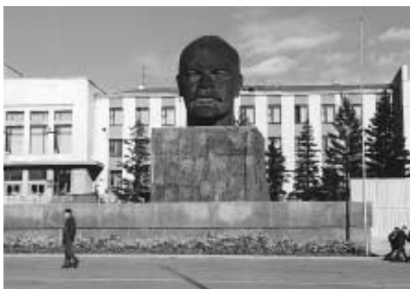
写真6 プリヤート共和国政府ビルの前に置かれたレーニンの頭像

ホテルの売店で見つけた絵葉書に貼る1ルーブル切手が、売店にもフロントにもなかったので、郵便局で求めた。係員が奥の部屋から持ってきたのは98年のデノミ以前の1,000ルーブル切手だ。ゼロが3つ余計についているが今でも通用する。この町の買い物には消費税に相当する税金