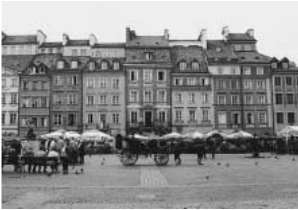
写真3 旧市街市場広場