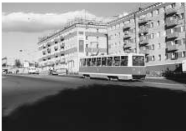
写真8 市内を走る路面電車

がかかるため、切手も割高になってしまった。モスクワでもっと買ってくるべきだったか。しかし全般に物価は安い。ホテルのランドリー・サービスの価格は日本の5分の1ほど。レストランの昼食は100ルーブル程で済んだ。