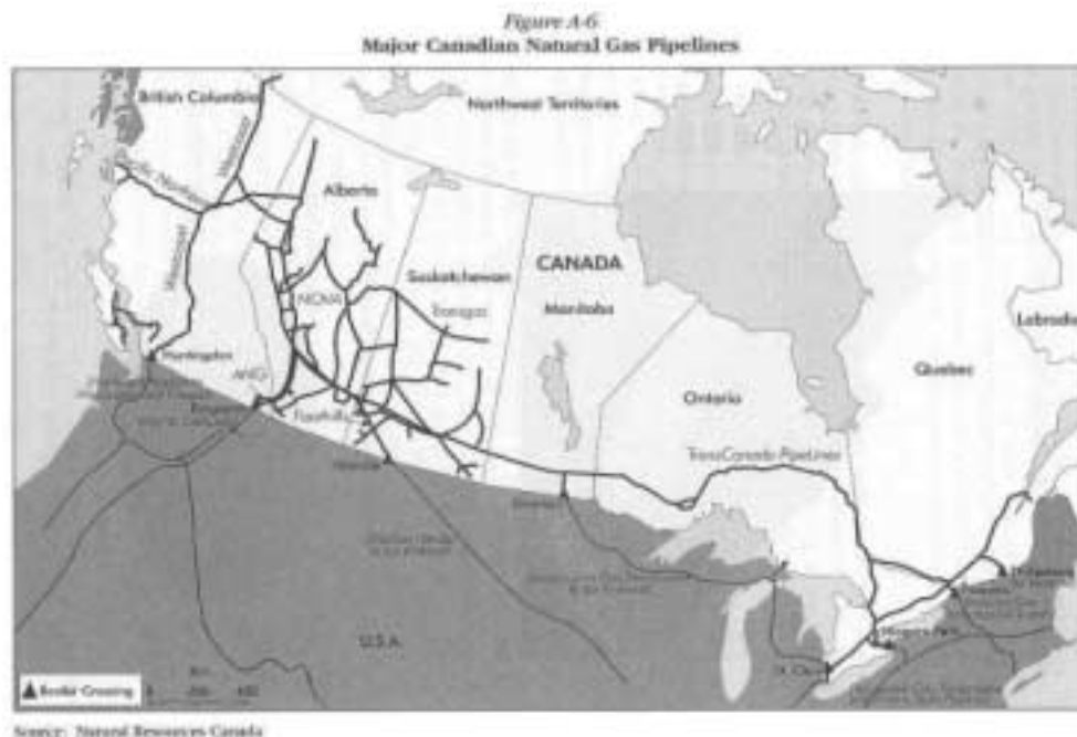
Figure 2. Canada's Gas Supply System and Cross-Border Pipelines