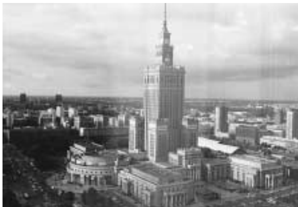
写真1 文科科学宮殿：スターリン様式の高層建築

プロトコールの内容は殆どが毎年取り上げられていることの繰り返しで、そのこと自体、問題が一向に解決されないことを意味している 5 。なぜ毎年同じ課題がテーブルの上に載り続けるのかということの関係者は真剣に考えてみる必要があるようだ。次回、2002年の総会はスイスのパー