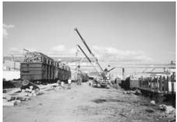
写真2 綏芬河駅での木材積み替え作業

綏芬河の街はロシア人で溢れ、またグロデコボにも大勢の中国人がいた。両国間を往来する人々は近年急増している。こうした往来の増大によって、国境通過をはじめとするさまざまな問題点が改善され、その結果としてさらに中口間、そして北東アジア各国間での交流が拡大していくことに期待している。