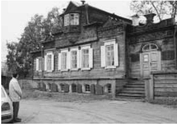
写真17 トルベッキーの家

は昔から木造建築が多かったが、百年ほど前に起きた火事で多くは燃え尽きてしまったという。観光コースとして、キーロフ広場、国立総合博物館歴史観（写真16）、オペリスク、デカプリスト記念館・トルベッキーの館など見て周った。1852年、サントペテルブルグで起きたデカプリストの乱で、首謀者の貴族たちはイルクーツクに流刑となり、この地で余生を過ごしたのがトルベッキーの家である（写真17）。もし、デカプリストの乱が成功していたならば、その後のロシアは全く違った道を進んでいただろうと考えると興味深い。