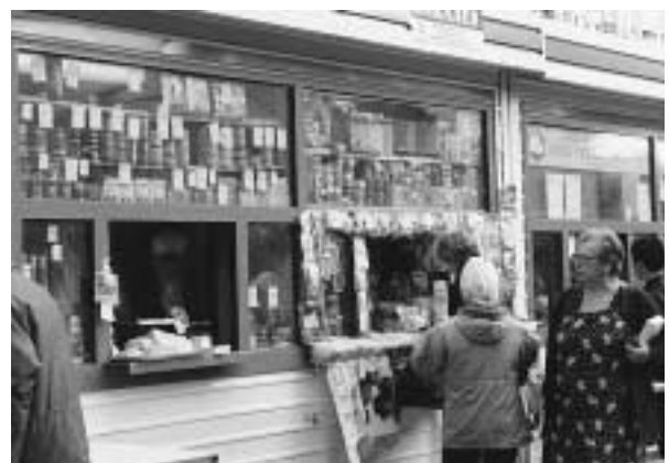
写真21 買い物をする人々

午後は、エネルギー、輸送の二つのセッションに分かれて分科会が開かれた。私は輸送分科会に出席したが、驚いたことに私が副議長に指名されていた。さらに、2日目の午前中のセッションでは議長に推されている。しかしこの分科会はロシア語で行われ、英語への通訳は必要な人に囁く方式で行われることになっているため私には困難と