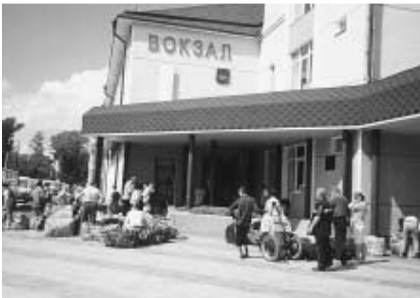
写真1 グロデコボ駅

また国境における積み替え施設についても今後さらなる改善が必要であると感じた。今回視察した綏芬河駅での積み替え状況は、木材を1本1本吊るし上げては別の貨車に移し変えるという非常に効率が悪くものであった。現在の輸送量には何とか対応しているようであるが、今後さらに取り扱い貨物量の増大を見込んでいのであれば、積み替