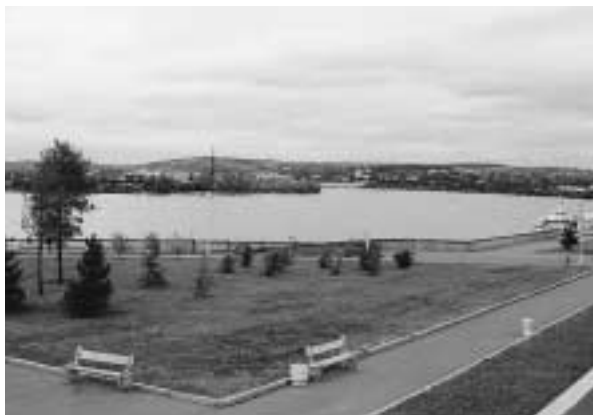
写真15 アンガラ川を望む

イルクーツク駅にはエネルギーシステム研究所の関係者が迎えに来てくれることになっていたが、9時間を越す遅れではそれも無いだろうと半ば諦め、タクシーを拾う覚悟をする。到着予定時刻の午後3時12分は大幅に過ぎ、イルクーツク到着は翌日の深夜0時半をまわっていた。停車すると大勢の客が降りた。薄暗い駅のホームに降り、通路に