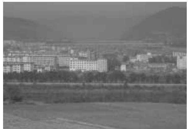
写真6 南陽付近（対岸は中国領、図們）

参加者からは「北朝鮮ということで構えてきたが、予想に反して大部分がOK。国境通過もスムーズでつまらなかった。もう少しトラブルを期待したのに」と、かなり無責任な発言もあった。ERINA側の心労、北朝鮮国家観光総局の軍・公安当局との折衝等、知る由もなかったのかも知れない。