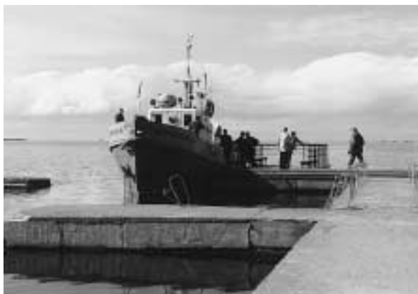
写真10 船に乗ってバイカル湖巡り

観光分科会の魅力は現地視察という名のオプションツアーが付くことだ。午後の会議を早めに切り上げると、バイカル湖の船着場に用意してあった船で湖巡りに出かけた(写真10)。クルトウシュナヤ・リゾートはバイカル湖の南