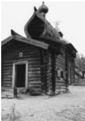
写真18 ログハウス風教会

アンガラ川を上ると、バイカル湖からアンガラ川へと流れ込む豊かな水を利用して発電するためのダムと水力発電所がある。おかげでイルクーツクは電力料金が安く、それ