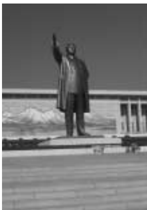
写真2 金日成主席像

平壤の北、バスで1時間半ほどの距離にある。標高1,000m台、最高峰の昆慮峰でも1,909mという山岳地帯。登山コースも整備されており2、3日の縦走も可能である。山間に11世紀に建立された普賢寺があり、奈良の名刹を彷彿させる。境内はきれいに掃き清められており、ごみ1つ落ちていない。これは北朝鮮のどの観光スポットにも言えることである。第1陣の訪問は9月上旬であったが、10月ともなれば山は紅葉一色でさぞかし華麗であろうと想像された。奈良と上高地が合わさったような素晴らしい景勝地である。この寺からバスで10分ほどの場所に国際親善博覧