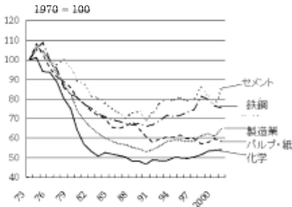
図-1 日本の産業分野別エネルギー効率の経年変化

る。第一次石油ショック以降、70年代、80年代、エネルギー効率はかなり大きな改善・向上を遂げている。縦軸はGDP当たりのエネルギー消費を示したものだが、90年以降エネルギーの集約度はほとんど変わっていない。改善がみられず、むしろ悪くなっている傾向にある。コスト効果のエネルギー効率を高めるための政策は使い尽くしたことになる。