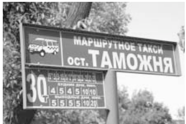
写真7 乗り合いタクシーの停留所