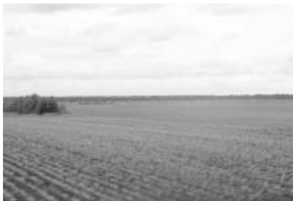
写真12 果てしなく広がる三江平原