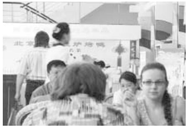
写真1 黒河のレストランのロシア人客

この中国料理レストランに限らず、市内中心部にあるケンタッキー・フライドチキンの店にも写真3のように、ロ