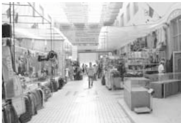
写真6 大黒河島国際商貿城の内部