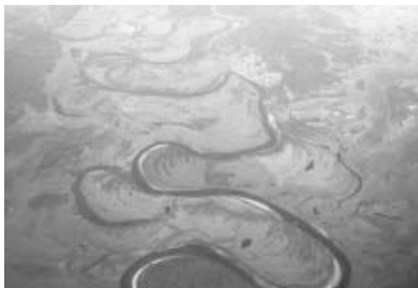
写真9 蛇行する川の上を飛ぶ

他の客たちは早々に入国審査を終え、審査場を出ていくが、私のパスポートは帰ってこない。他の入国審査官たち