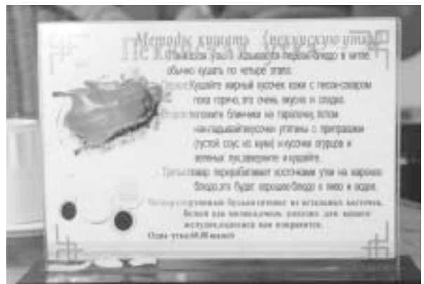
写真2 ロシア語のメニュー