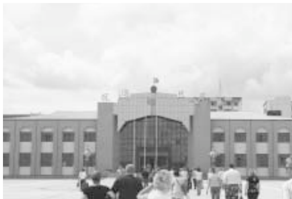
写真11 観光客でにぎわう撫遠口岸