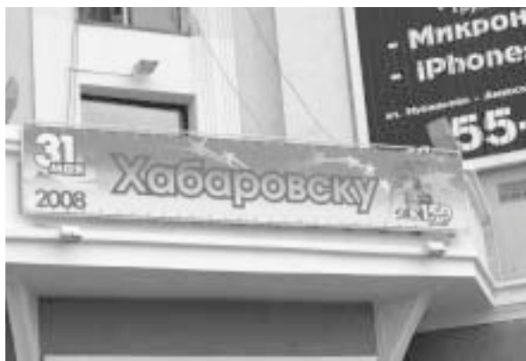
写真10 ハバロフスクは建立150周年