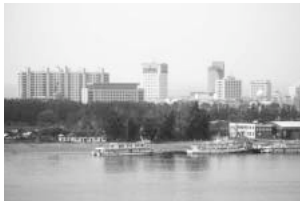
写真8 ブラゴベシェンスクから見た黒河