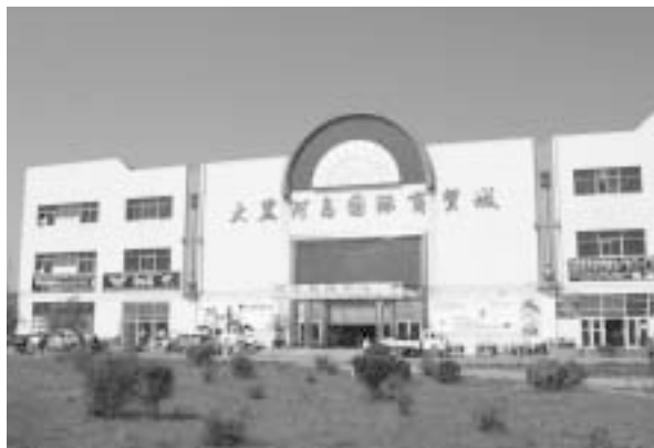
写真5 大黒河島国際商貿城の外観

黒河を出発した船は、10分ほどで対岸のブラゴベシェンスクの船着き場に到着した。中国側は高い堤防がないのだが、ロシア側はかなり高い堤防があるので、埠頭から出入国施設まで40段ほど登らなくてはならなかった。ロシア側の入国審査でもここを通る日本人は珍しいらしく、パス