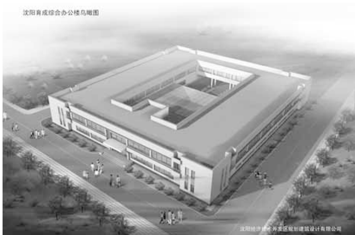
図2 瀋陽日本中小企業パーク育成センターイメージ図

プロジェクトのスキームは、土地の提供、造成、建屋建設を中国側で行い、パークのPR、入居手続やクレーム処理、優遇措置の付与などは開発区日本招商局と日本側が共同で