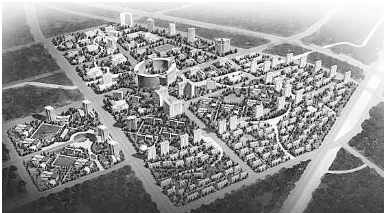
図3 瀋陽国際ソフトウェアパークイメージ図