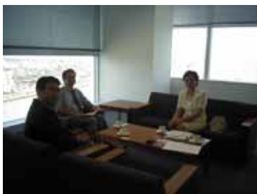
大连元裕贸易有限公司新泻支店长访问 ERINA