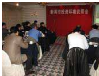
新泻在上海举行招商中国企业说明会