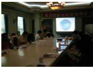
新泻在沈阳举行招商中国企业说明会

团到新泻考察;上海招商会有 17 家企业赴会, 3 家表示有意愿未来投资。今年, 新泻市还准备在北京、天津举办同样的说明会。截至 2006 年 5 月, 新泻市的招商已经结出初步硕果。中国国内著名民营企业北京章光 101 毛发再生集团已经在新泻设立办事处, 相关日本法人的申请也在进行之中; 大连元裕贸易有限公司在新泻设立了支店, 并派遣了支店长长期驻日; 中国东北著名餐饮企业、中国百强餐饮企业之一的东方饺子王餐饮连锁公司连续三次赴日考察和参加相关的食品博览会, 在新泻市民中取得了很大的反响。