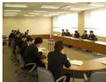
北京章光 101 集团赴新泻洽谈投资事宜(已设立办事处)