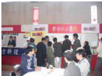
哈尔滨东方饺子王参展新泻食品博览会