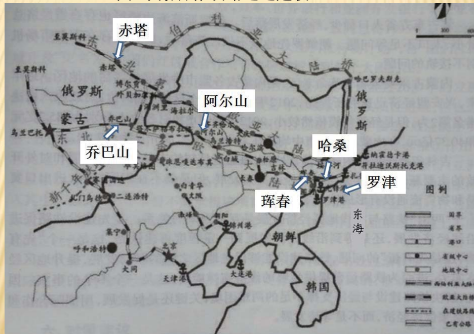
〈图2中蒙合作铁路通道建设〉