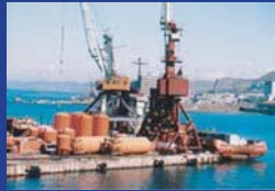
▲ロシア石油資源開発