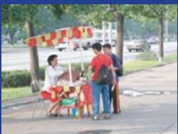
▲北朝鮮・ピョンヤン