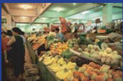
▲中国のスーパーマーケット