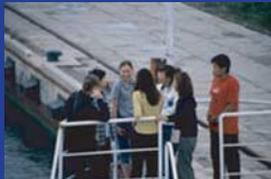
▲ロシア⇄韓国定期船上