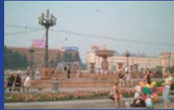
▲ロシア・ハバロフスク